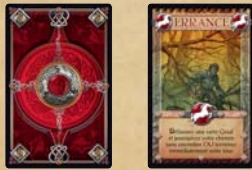
Dos de carte Voyage Errance x2